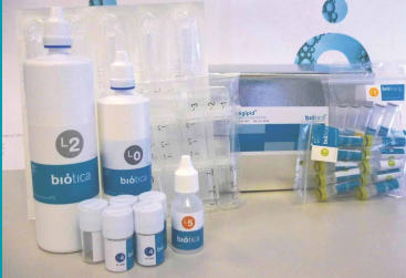
Legipid® Legionella Fast Detection kit