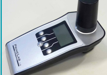
Primelab Fotómetro Multiparamétrico