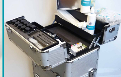
Maletín AllinOne Legionella Detection